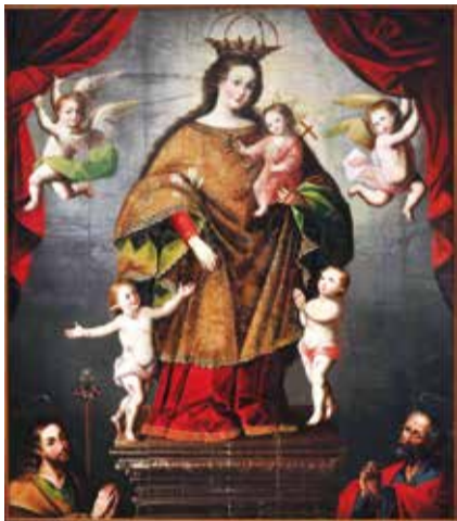
Virgen de la Caridad con santos