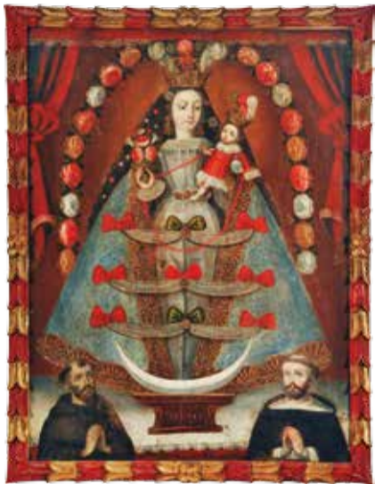
Nuestra Señora del Rosario de Pomata con santos