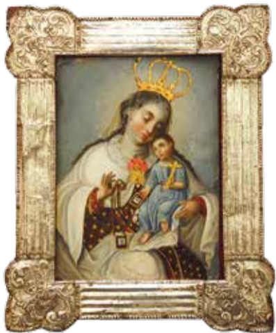
Virgen del Carmen