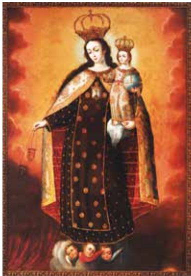
Virgen del Carmen