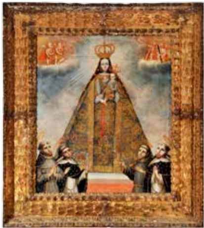
Virgen de Belén