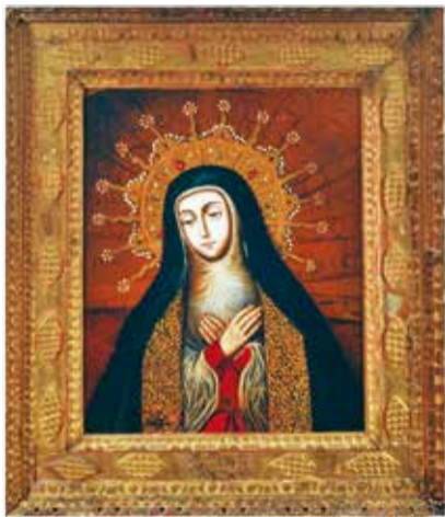
Nuestra Señora de la Soledad